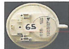
ΠΙΕΖΟΣΤΑΤΗΣ ΑΕΡΑ(6225715) ΠΙΕΖΟΣΤΑΤΗΣ ΑΕΡΑ(6225707)