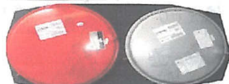
ΔΟΧΕΙΟ ΔΙΑΣΤΟΛΗΣ 7 L (5139140) ΔΟΧΕΙΟ ΔΙΑΣΤΟΛΗΣ 9 L (5139130)