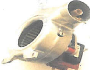
ΑΝΕΜΙΣΤΗΡΑΣ (6225632) ΑΝΕΜΙΣΤΗΡΑΣ (6225624)