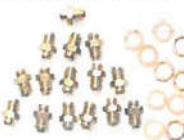
KIT LPG ZIP35(5144716) KIT LPG ZIP25(5144712) KIT LPG ZIP30(5144713)