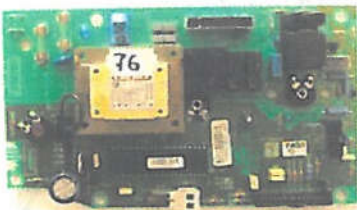
ΚΕΝΤΡΙΚΗ ΜΟΝΑΔΑ (6230630)