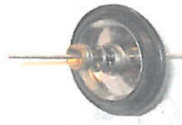
ΒΑΛΒΙΔΑ (6281503) ΜΕΜΒΡΑΝΗ ΒΑΛΒΙΔΑΣ (6153101)