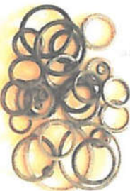
ΟΡΙΝΓΚ (6226417) ΟΡΙΝΓΚ (6226429) ΟΡΙΝΓΚ (6226412) ΟΡΙΝΓΚ (6022010) ΟΡΙΝΓΚ (6226414) ΟΡΙΝΓΚ (6226421) ΟΡΙΝΓΚ ΣΕΤ (6281506)