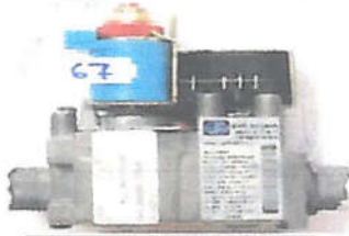
ΒΑΛΒΙΔΑ ΑΕΡΙΟΥ (6243810)